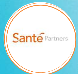
Maaïke Steenbeek- Boekema

Met extra tijd en aandacht mensen met een afstand tot de arbeidsmarkt begeleiden naar betaald werk. Iedereen is uniek. Met de juiste begeleiding zijn ze GOUD waard