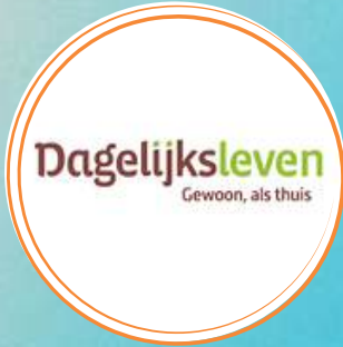
Willy van Erdhuizen

13:00 - 13:45 uur, Experience Center Nijmegen