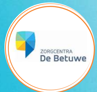
Wendy Lieberwerth & Mieke Koning

In deze praktische sessie krijgen de deelnemers inzicht en praktijkgerichte handvaten om op onbegrepen gedrag te reageren. Daarnaast leer je hoe je cliënten kunt afleiden door het aanbieden van geluksmomenten waardoor de cliënt zichzelf kan zijn en onbegrepen gedrag kan verminderen.