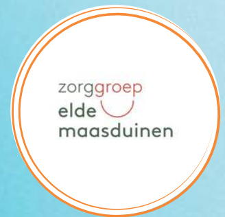
Linsey van de Ven & Marlon de Bijl

In deze sessie verkennen we het complexe gedrag van mensen met dementie, met een nadruk op zelfreflectie en begrip. We streven naar een mensgerichte benadering die verbinding en contact centraal stelt.