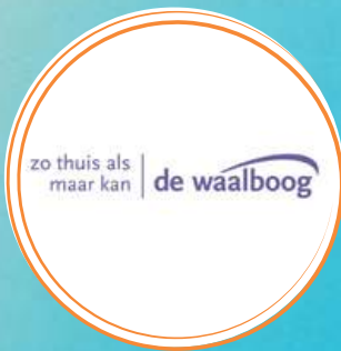
Eline van Buuren & Charlotte van Corven

13:00 - 13:45 uur, Koning Willem I College, Den Bosch