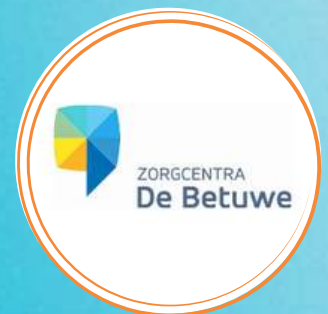
Wendy Lieberwerth & Mieke Koning

In deze praktische sessie krijgen de deelnemers inzicht en praktijkgerichte handvaten om op onbegrepen gedrag te reageren. Daarnaast leer je hoe je cliënten kunt afleiden door het aanbieden van geluksmomenten waardoor de cliënt zichzelf kan zijn en onbegrepen gedrag kan verminderen.