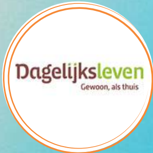
Willy van Erdhuizen

13:00 - 13:45 uur, Experience Center Nijmegen