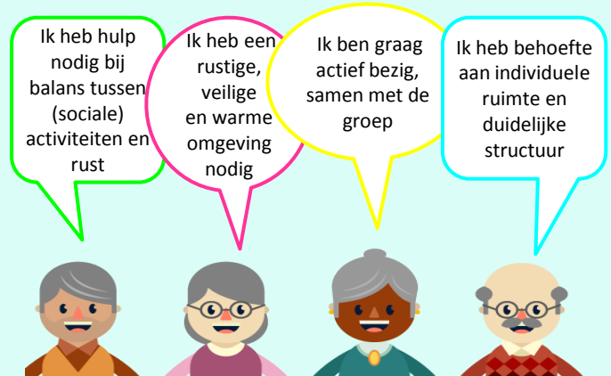
Figuur 1: Belangrijkste behoeften per type leefmilieu